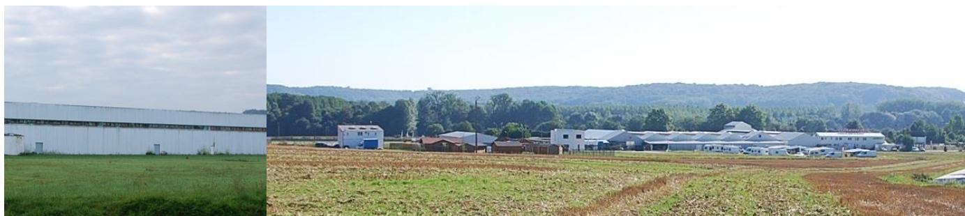
Ancienne usine AVON

Il existe par ailleurs au sein de la plaine agricole un site industriel et une zone commerciale, implantée en bordure de la RD 1016, axée sur le commerce de « loisirs » (jardiland) et d'équipements de la maison (vérandas, poêles à granulés, décoration...).