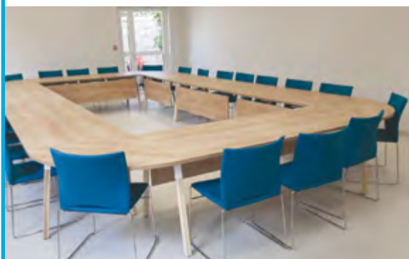
La salle du conseil municipal

Le bâtiment principal est dédié à l'accueil du public, des services administratifs, ainsi qu'au bureau de la police municipale et à la salle du conseil municipal.